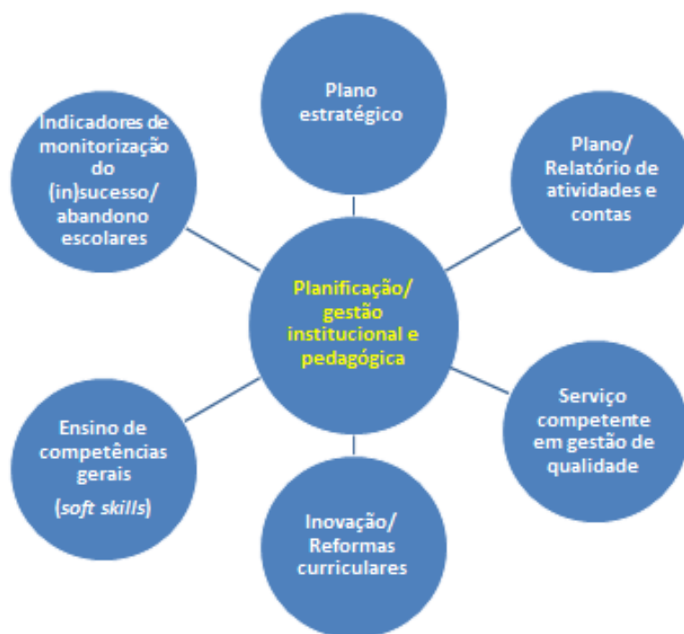
Figura 1.1 – Medidas do processo-chave de Planificação/gestão institucional e pedagógica

A maioria das IES públicas possui planos estratégicos e relatórios de atividade em que o combate ao insucesso e abandono escolares é relevado em orientações ou objetivos estratégicos, ações, indicadores e metas a atingir, assim como no reporte dos resultados alcançados (este, geralmente, no último tipo de documento).