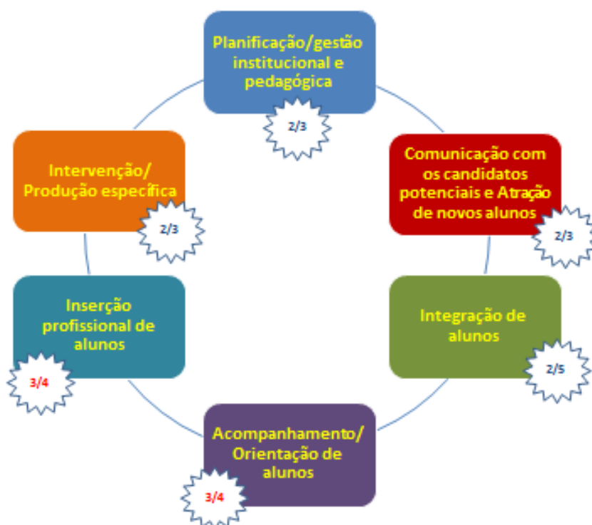
Figura 2 – Registo dos processos-base relevantes para a promoção do sucesso escolar em universidades públicas

Assim, excetuando o momento/processo da integração de alunos , em que só 2/5 das universidades públicas revela medidas próprias, nos restantes momentos a maioria já as apresenta, nomeadamente: