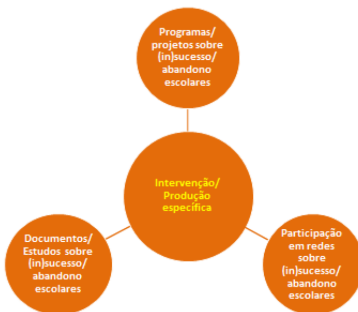
Figura 1.6 - Medidas do processo-chave de Intervenção/Produção específica

Nos processos/momentos-chave anteriores foi feita a inventariação e a caracterização sumária das dimensões com impacte mais relevante no combate ao insucesso e abandono escolares, bem como a avaliação da importância que lhes é atribuída por parte das IES públicas. Importa, ainda, destacar quais destas têm uma intervenção mais direta sobre o problema.