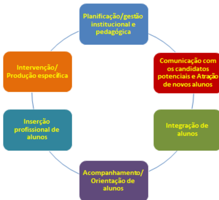
Figura 1 – Processos/Momentos-chave para a promoção do sucesso escolar

Na pesquisa efetuada nos sítios das diversas universidades, politécnicos, institutos, escolas e faculdades, procurou-se identificar e caracterizar os registos sobre cada uma das dimensões destes processos.