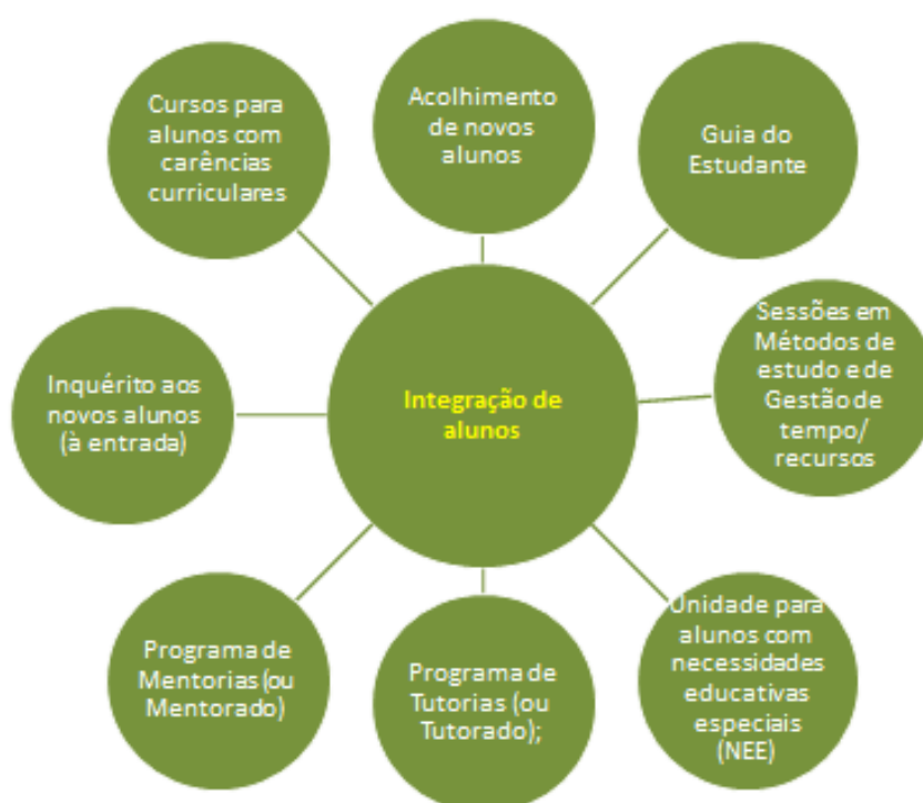
Figura 1.3 - Medidas do processo-chave de Integração de alunos

Em maior ou menor grau, todas as IES desenvolvem atividades para facilitar o período de adaptação ou de inserção dos novos alunos, estejam estes a iniciar um percurso no ensino superior ou sejam provenientes de outras instituições. Estas atividades são modeladas em função do tipo de alunos e do seu regime de acesso e têm maior incidência nos primeiros meses ou ano de frequência (salvo algumas que se prolongam ao longo do ciclo de estudos).