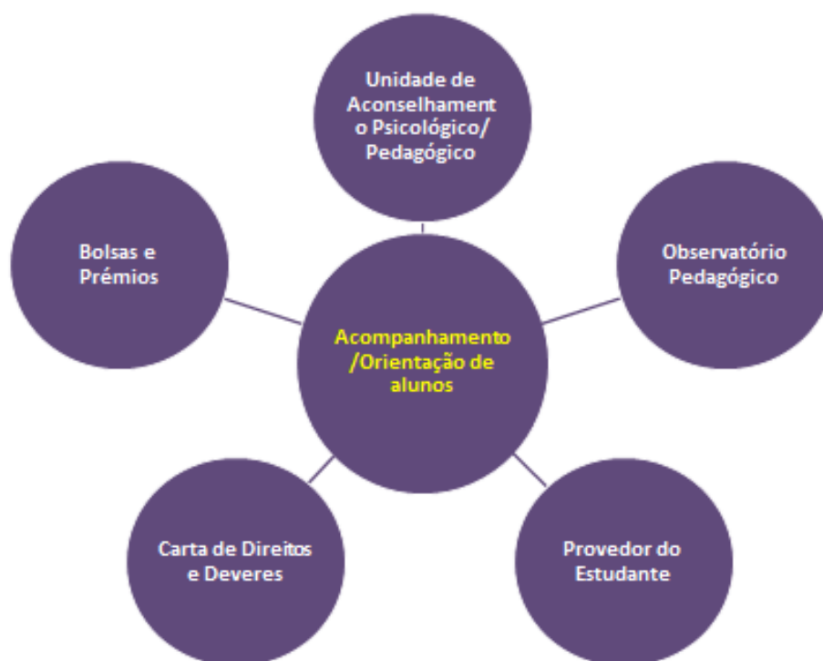
Figura 1.4 - Medidas do processo-chave de Acompanhamento/Orientação de alunos

Ainda que os programas de tutoria e mentoria sejam essencialmente dispositivos de integração de alunos, são também instrumentos de acompanhamento e orientação, tanto mais relevantes nestas funções quanto maior for a sua duração no percurso escolar daqueles. De facto, tal como a mentoria, “a tutoria visa o desenvolvimento pessoal e social, académico e profissional que vá para além da escolarização, munindo o aluno de competências e de “empowerment” que lhe permitam aprender ao longo da vida.” (Semião, 2009: 55-56).