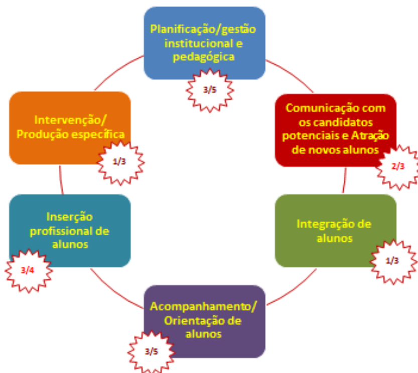
Figura 3 - Registo dos processos-base relevantes para a promoção do sucesso escolar em politécnicos públicos

A inserção profissional de alunos é também o momento-chave mais relevante no subsistema do ensino politécnico público (3/4 dos casos) e os menos relevantes são o de integração de alunos e de intervenção/produção específica (ambos 3/10 dos casos). Os outros três momentos considerados voltam a mostrar o protagonismo maioritário dos politécnicos públicos: (pouco) mais de metade relativamente à planificação/gestão institucional e pedagógica , 3/5 no respeitante ao acompanhamento/orientação de alunos e 2/3 quanto à comunicação/atração de alunos .