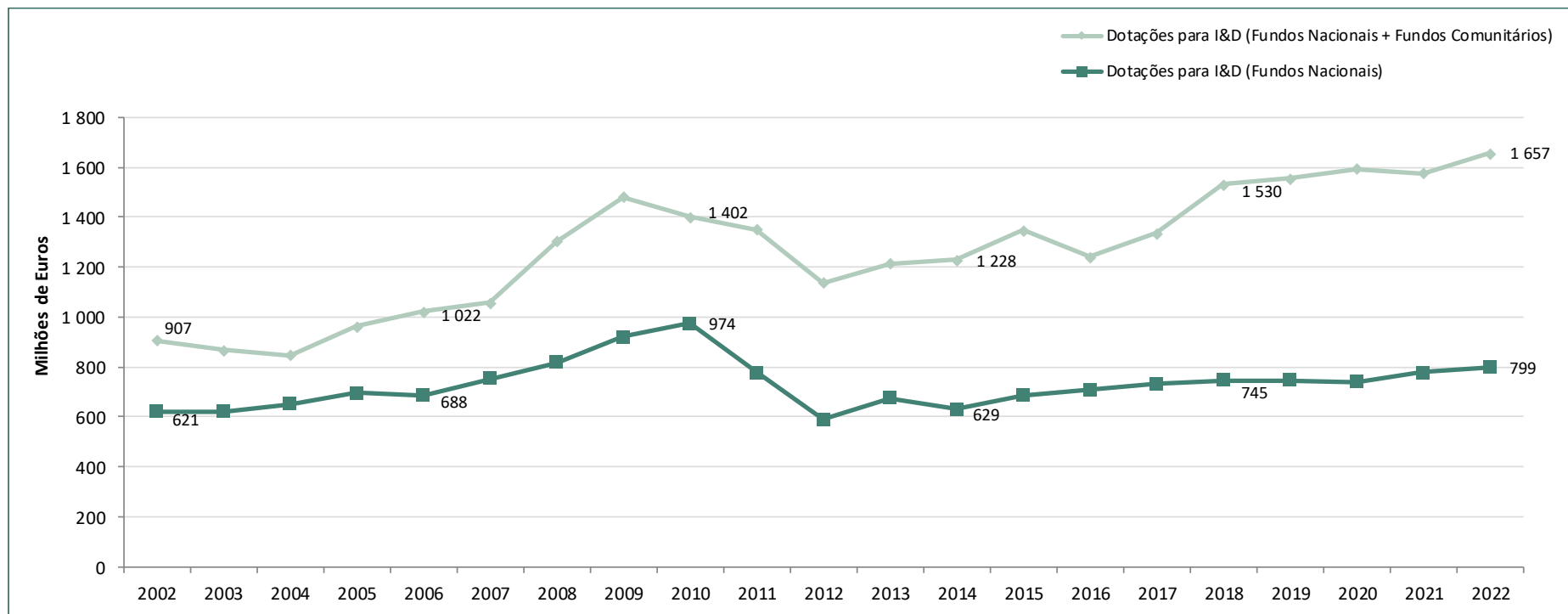
Figura 1 - Dotações Orçamentais para I&D (2002 - 2022) - Preços correntes